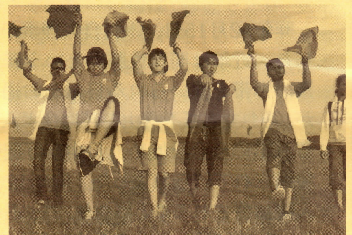
青少年サマーキャンプでの踊り交流