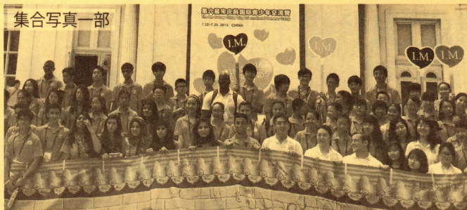
第4回宋慶齡基金会国際青少年サマーキャンプ